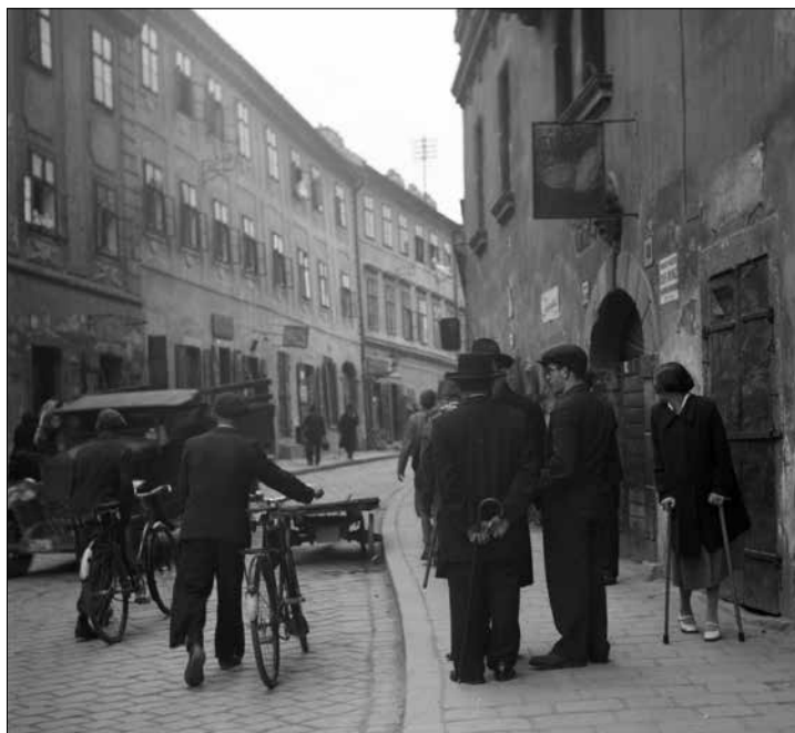
Obrázok 1: Bývalá židovská štvrť pod hradom v Bratislave

Slovenský štát existoval len mesiac, keď jeho čelní predstavitelia prijali Vládne nariadenie o vymedzení pojmu žid a obmedzení počtu židov v niektorých slobodných povolaniach z 18. apríla 1939. Okrem zníženia počtu Židov vykonávajúcich povolania, akými boli napríklad advokát, lekár, lekárnik, či redaktor, toto nariadenie predstavovalo prvú legislatívnu definíciu pojmu Žid vychádzajúcu z konfesijného princípu. Nasledovali ďalšie vládne nariadenia s mocou zákonov, ktoré postupne vylučovali Židov z verejného a hospodárskeho života krajiny. Prvý arizačný zákon bol prijatý v apríli 1940. Na jeho základe mali židovskí majitelia v rámci tzv. „dobrovoľnej arizácie“ navrhnuť kvalifikovaného kresťana, ktorý by odkúpil, resp. získal podiel vo výške aspoň 51 % ich firmy. Zákon umožňoval Židom ostať v menšinovom spoluvlastníctve podniku. Keďže prioritou HSLŠ bola spočiatku konsolidácia režimu v novom štáte, protižidovské nariadenia prijaté v tejto fáze mali za úlohu postupne pauperizovať židovskú komunitu a následne sa zbaviť čo najväčšieho počtu Židov dobrovoľnou emigráciou (najmä do Palestíny, ktorá už od roku 1939 prijímala emigrantov). Túto možnosť však využilo do leta 1940 len okolo 6 000 osôb, čo spôsobilo nespokojnosť slovenskej vlády.