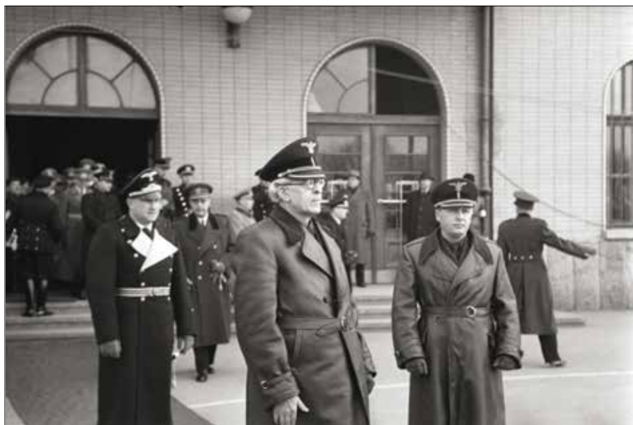
Obrázok 5: Predstavitelia radikálneho krídla HSL'S – V. Tuka a A. Mach s nemeckým vyslancom H. Ludinom

Na Slovensku zostalo po prvej deportačnej vlne a zúfalých migráciách do susedného Maďarska, odkiaľ v danom čase transporty neprebíhali, ešte okolo 16 000 Židov (časť z nich chránená prezidentskými a ministerskými výnimkami, ktoré sa vzťahovali na celú rodinu). Aj keď sa minister vnútra Alexander Mach vo februári 1943 v Ružomberku vyhráždil, že transporty obnoví už v marci alebo apríli, nestalo sa tak. Hoci boli deportácie zo Slovenska na čas pozastavené, konečné riešenie židovskej otázky ešte nepovedalo svoje posledné slovo. Nemecko vyvíjalo tlak na slovenskú vládu, aby židovskú otázku vyriešila raz a navždy. Tlak zosilnel potom, čo nemecké jednotky v marci 1944 obsadili Maďarsko. Edmund Veessenmayer, novovymenovaný splnomocnenec v Maďarsku, žiadal koordinovaný postup Maďarska a Slovenska (najmä s nemeckým vyslancom na Slovensku Hannsom Ludinom) v riešení židovskej otázky.