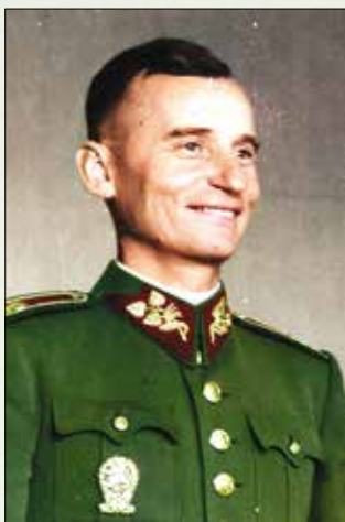
Generál Ján Golian

Povstalecký veliteľ a hlavný iniciátor vojenskej stránky Slovenského národného povstania. Statočne sa postavil nemeckej presile a bojoval za slobodu vlastného národa.