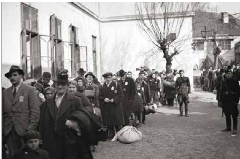
Obrázok 3: Deportácie Židov zo Slovenska

Na základe dohody s nemeckou stranou mal jeden transport obsiahnuť tisíc osôb, v jednom dobytčom vagóne sa malo nachádzať asi 40 ľudí.