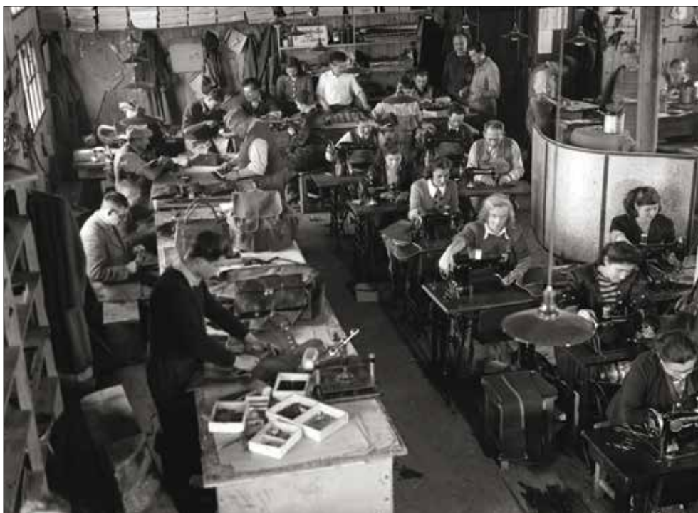
Obrázok 2: Židovskí internanti pri práci v tábore na území Slovenska

Protižidovské opatrenia na Slovensku kulminovali prijatím vládneho nariadenia č. 198/41 (tzv. Židovského kódexu ) dňa 9. septembra 1941. Podľa vzoru norimberských zákonov nová právna norma vymedzovala pojem Žid na základe rasového a nie náboženského princípu a drakonicky regulovala verejný a hospodársky život židovskej komunity, ako aj jej občianske práva. Kódex nariaďoval Židom, zbaveným majetku a občianskych práv, nosenie rozlišovacieho znaku – žltej šesťcípkej hviezdy na viditeľnom mieste. Keďže pod rasový princíp spadali podľa zákona už i pokrstení a poloviční Židia, a dokonca aj zmiešané manželstvá, bol Židovský kódex považovaný za prísnejší ako nacistické zákony.