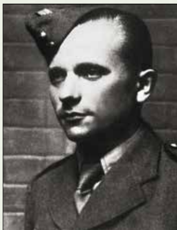
Generálmajor in memoriam Jozef Gabčík

Slovenský účastník zahraničného odboja. Bol hlavným veliteľom atentátu na ríšskeho protektora R. Heydricha. Túto operáciu vykonal aj za cenu obetovania vlastného života.