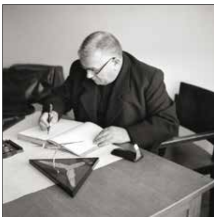
Obrázok 4: Jozef Tiso, ktorý podpisom schválil deportácie slovenských Židov

Prvý transport s vyše 900 práceschopnými slobodnými židovskými ženami a dievčatami vo veku 16 až 45 rokov bol vypravený z Popradu dňa 25. marca 1942. Jeho cieľovou stanicou bol Osvienčim. Medzi 25. marcom a 4. aprílom 1942 odišlo zo Slovenska osem transportov. Všetky transporty boli rozdelené na mužské a ženské. Na základe návrhu Alexandra Macha sa 11. apríla 1942 začalo s tzv. rodinnými transportmi. Napriek tomu, že na Slovenku prebiehali deportácie už dva mesiace, ústavný zákon o vystaňovaní Židov nadobudol účinnosť až po prerokovaní Snemom Slovenskej republiky v máji 1942 a podpise prezidenta. Deportácie tak nabrali rýchly spád a v prvej vlne do jesene bolo zo Slovenska násilne vyvezených vyše 57 000 Židov v 57 vypravených transportoch. Do Osvienčimu smerovalo 19 transportov s vyše 18 000 osobami a do lublinskej oblasti 38 transportov (okolo 39 000 Židov). Transporty boli pozastavené v októbri 1942. Posledný transport bol vypravený 20. októbra.